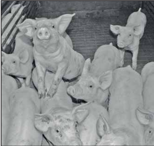
Vleesvarkentjes in de bio-industrie