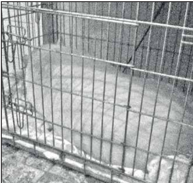
Minivarken in huis