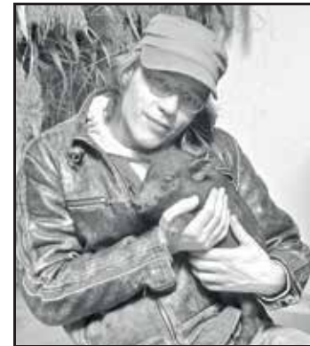
Giel met Dappere Dodo - nu een TANK van een beer